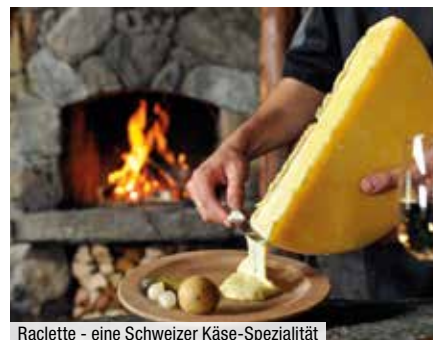
Raclette - eine Schweizer Käse-Spezialität