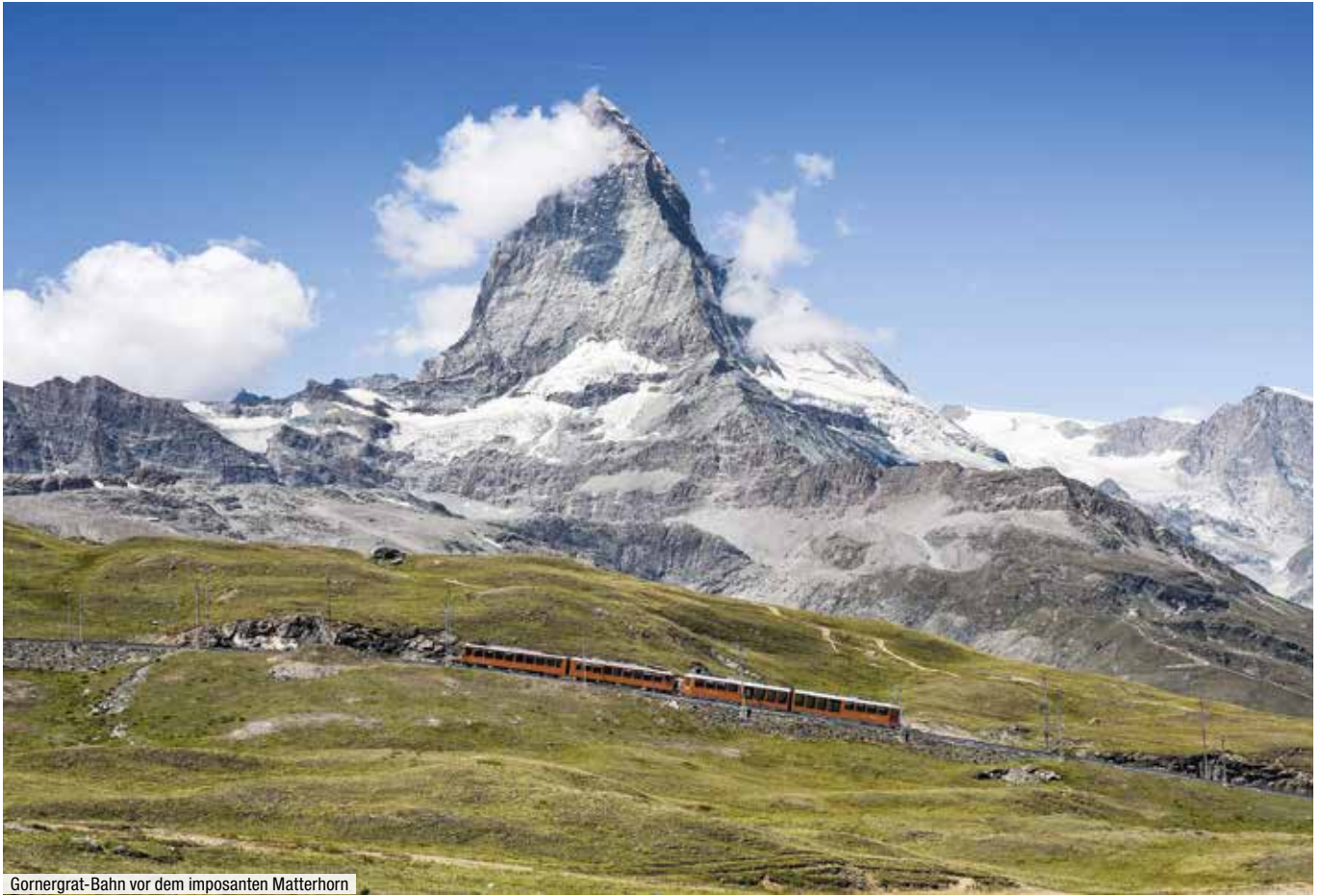
Gornegrat-Bahn vor dem imposanten Matterhorn