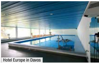
Hotel Europe in Davos

Das Hotel*** Bergfreund in Herbruggen sowie das Hotel**** Europe in Davos haben schon viele unserer Kunden schätzen und lieben gelernt. Das etwas einfachere, aber sehr familiär geführte „Bergfreund“ mit der Gastwirtin Rosie zeichnet sich durch Schweizer Herzlichkeit sowie sehr gute und reichhaltige Küche aus. Das Hotel „Europe“ in Davos bietet in seiner zentralen und günstigen Lage direkt am Bahnhof ein komfortables Urlaubsdomizil zum Wohlfühlen und Relaxen mit Sonnenterrasse und 2 Restaurants, die mit internationalen und regionalen Schweizer Spezialitäten verwöhnen.