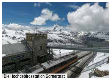
Die Hochgebirgsstation Gornergrat