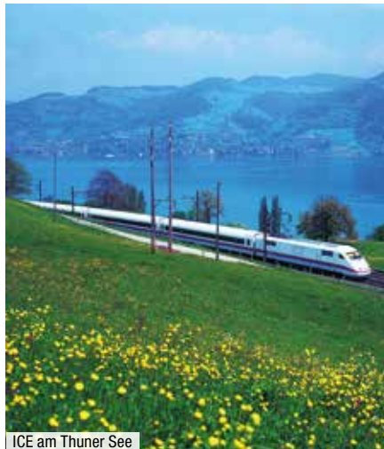
ICE am Thuner See