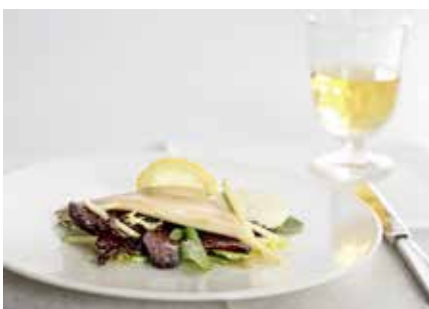
Mittagessen im Glacier-Express