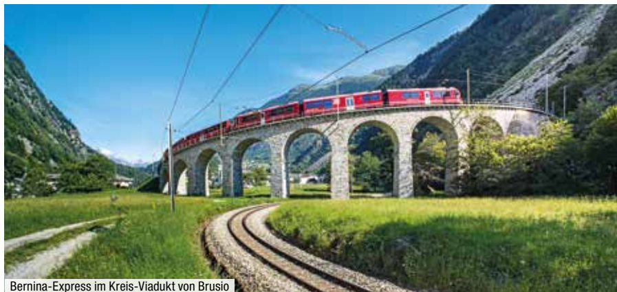
Bernina-Express im Kreis-Viadukt von Brusio

Sie reisen individuell von Ihrem Wohnort nach Basel SBB. Dort starten wir gemeinsam um 14:30 Uhr mit dem Zug über die Lötschbergbahn nach Visp und weiter nach Herbruggen. Basel SBB (der Hauptbahnhof von Basel) wird mindestens einmal pro Stunde von den Fernverkehrszügen der DB angefahren. Durchgehende Verbindungen gibt es von Berlin, Hamburg und aus dem Rhein-/Ruhrgebiet, die ebenso mit einmal Umsteigen aus allen anderen Regionen Deutschlands erreicht werden. Die Rückreise erfolgt von Davos nach Landquart und von dort mit einem durchgehenden ICE via Basel nach Frankfurt (ca. 16:00 Uhr) und Hamburg (ca. 19:35 Uhr). Unterwegs Umstiegsmöglichkeiten mit günstigen Anschlüssen ins Rhein-/Ruhrgebiet, nach Berlin sowie Thüringen, Sachsen-Anhalt und Sachsen. Gerne suchen wir Ihnen die besten Verbindungen heraus und beraten Sie zu Ihrer Anreise. Fahrplanstand 10/2021