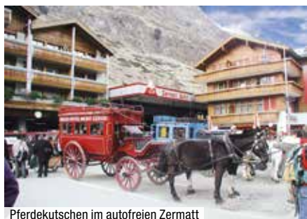
Pferdekutschen im autofreien Zermatt