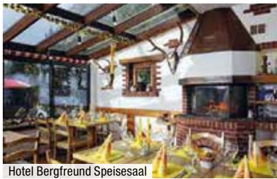
Hotel Bergfreund Speisesaal