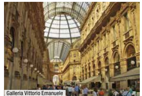
Galleria Vittorio Emanuele

Wir verbringen einen freien Tag im Hotel und im schönen Stresa. Fakultativ bietet unser Reiseleiter einen Ausflug per Bahn nach Mailand an. Die imposante Kathedrale aus weißem Marmor, Scala, Börse, auf Wunsch da Vincis „Letztes Abendmahl“, Castello Sforzesco, exklusive Modehäuser, die luxuriöse „Galleria Vittorio Emanuele“, elegante Restaurants und gemütliche Cafés - Mailand vereint historischen Glanz und modernen Glamour auf unnachahmliche Weise miteinander. Schon unsere Ankunft mit dem Zug ist ein Erlebnis. Denn Milano Centrale gilt als einer der größten und schönsten Kopfbahnhöfe Europas. Drei Hallen, mit Figuren und Mosaiken dekoriert, bieten das faszinierende Entree in diese Weltmetropole, die wir bei unserem Rundgang näher kennenlernen. (F,A)