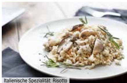
Italienische Spezialität: Risotto