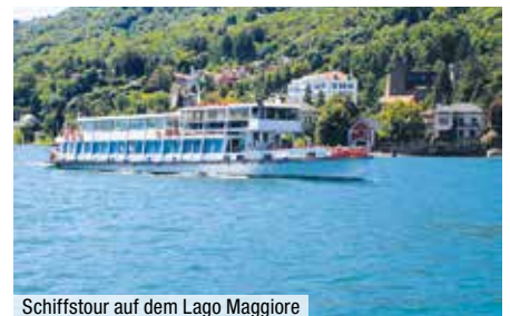
Schiffstour auf dem Lago Maggiore