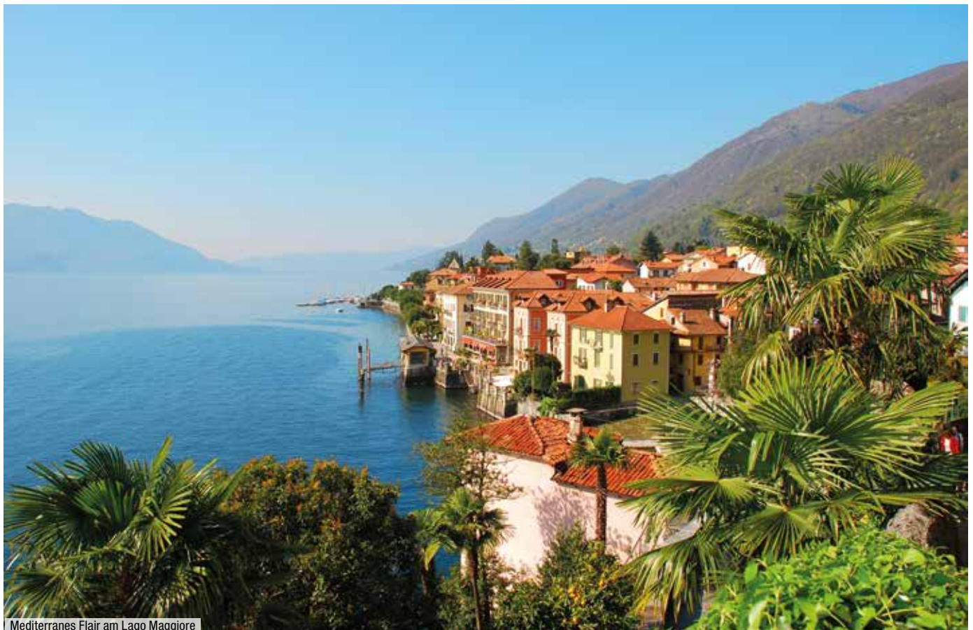
Mediterranes Flair am Lago Maggiore