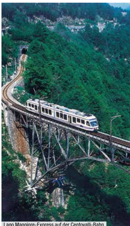
Lago Maggiore-Express auf der Centovalli-Bahn

Vorvertragliche Informationen: Programmänderungen vorbehalten. Für diese Reise ist ein gültiger Reisepass oder Personalausweis erforderlich. Teilnehmerzahlen: mindestens 15, max. 25 Teilnehmer. Veranstalter: FITT Tours GmbH, Köln in Kooperation mit Die Eisenbahn Erlebnisreise Arnold Kühn; gemäß AGB kann diese Reise bis 30 Tage vor Abreise wegen Nichterreichen der Teilnehmerzahl abgesagt werden. Nach Buchung ist eine Anzahlung von 20 % fällig. Der Restbetrag ist bis 30 Tage vor Abreise zu bezahlen.