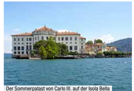
Der Sommerpalast von Carlo III. auf der Isola Bella