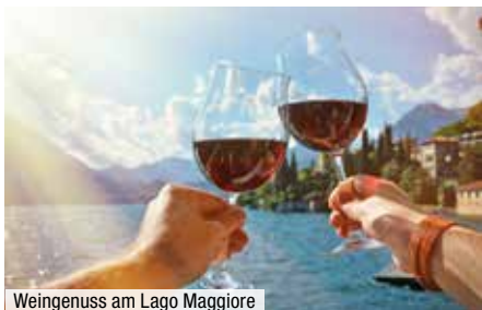
Weingenuß am Lago Maggiore