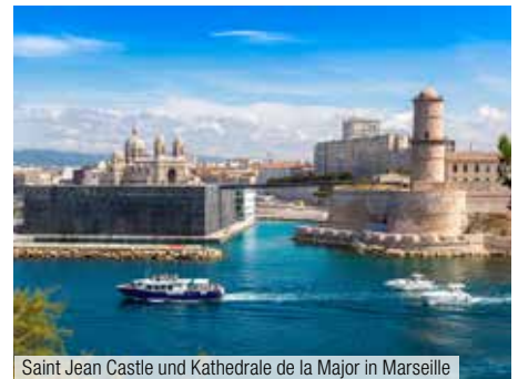
Saint Jean Castle und Kathedrale de la Major in Marseille