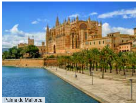
Palma de Mallorca