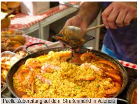
Paella-Zubereitung auf dem Straßenmarkt in Valencia