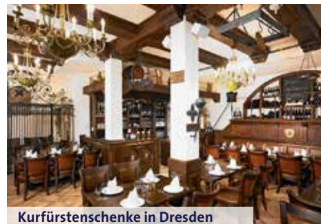
Kurfürstenschänke in Dresden