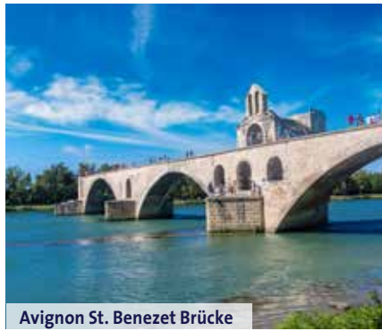
Avignon St. Benezet Brücke