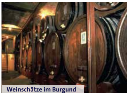
Weinschätze im Burgund