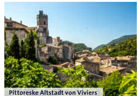
Pittoreske Altstadt von Viviers