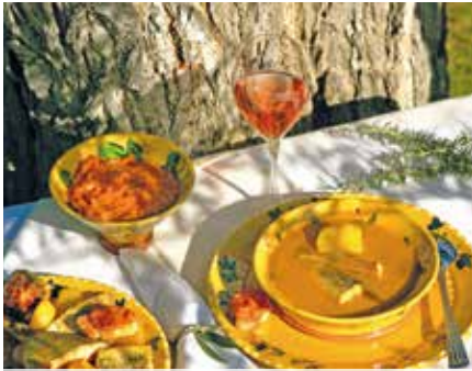
Bouillabaisse - südfranzösische Lebensart