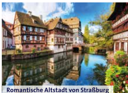
Romantische Altstadt von Straßburg