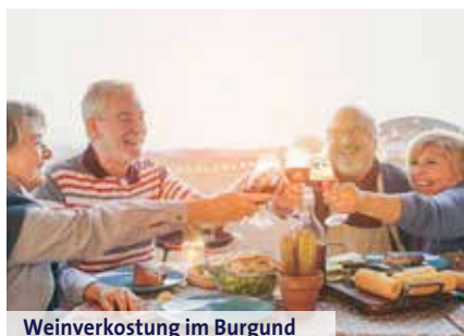
Weinverkostung im Burgund

Zwecken gegründet und deren Einkünfte aus Weingärten und Ackerflächen für die Armen verwendet wurde. Unser Besuch der Senfproduktion Fallot in Beaune rundet den Nachmittag ab. Hier wird der Senf noch seit 1840 ganz traditionell nach überlieferten, handwerklichen Methoden hergestellt. Wir fahren zurück zum Hotel und freuen uns auf das gemeinsame Abendessen im Hotelrestaurant. (F,A)