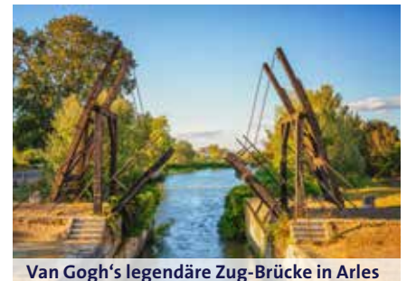
Van Gogh's legendäre Zug-Brücke in Arles