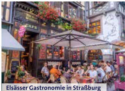
Elsässer Gastronomie in Straßburg