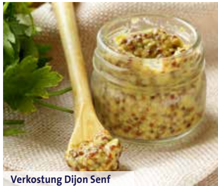
Verkostung Dijon Senf