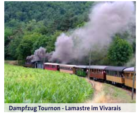
Dampfzug Tournon - Lamastre im Vivarais