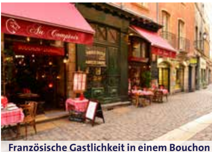
Französische Gastlichkeit in einem Bouchon