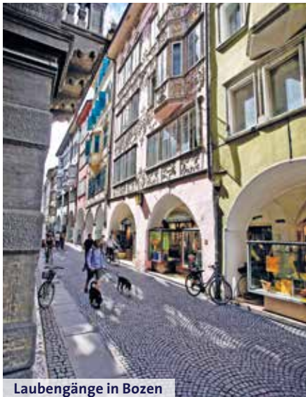
Laubengänge in Bozen