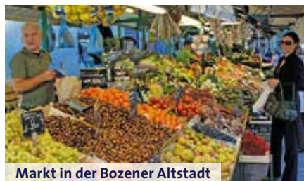
Markt in der Bozener Altstadt