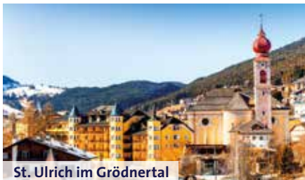
St. Ulrich im Grödnertal