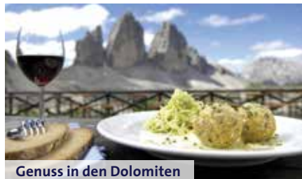
Genuss in den Dolomiten