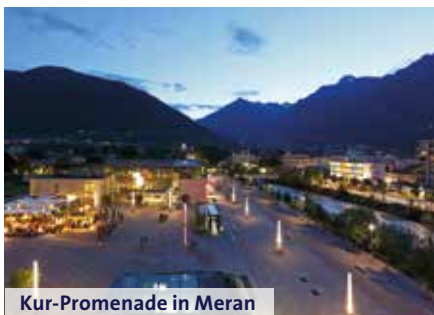
Kur-Promenade in Meran