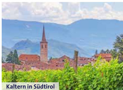
Kaltern in Südtirol