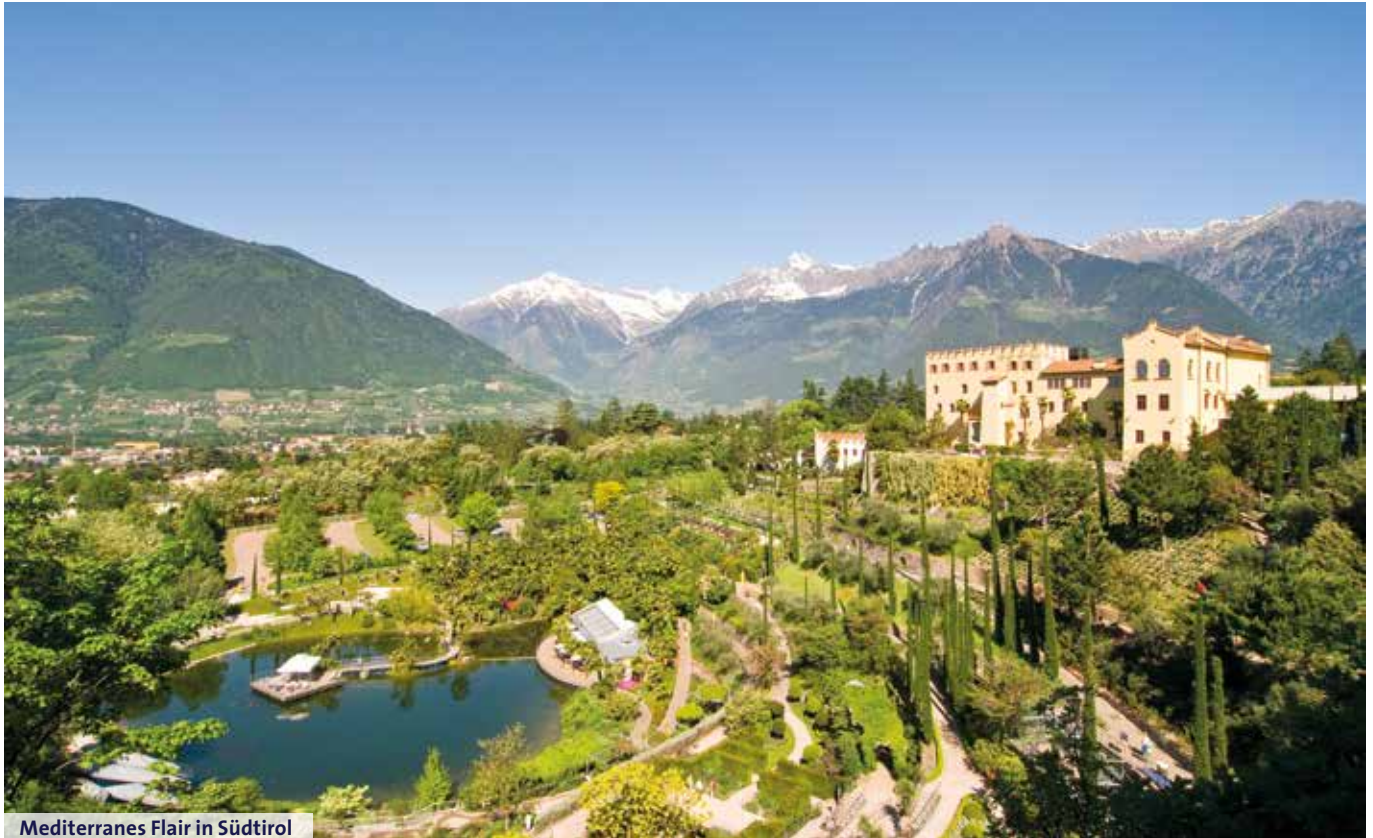
Mediterranes Flair in Südtirol