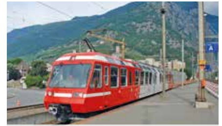
Der Mont-Blanc-Express ist abfahrtbereit