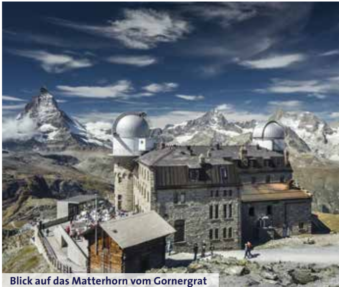
Blick auf das Matterhorn vom Gornergrat