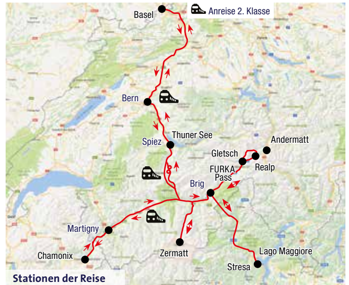
Stationen der Reise