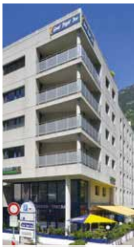
Hotel Good Night Inn (3***)

Unser Hotel ist zentral und ruhig gelegen und verfügt über den zeit-