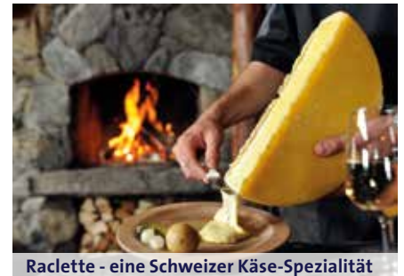
Raclette - eine Schweizer Käse-Spezialität