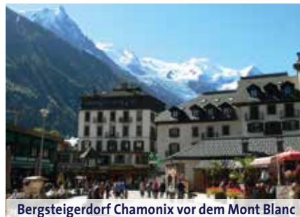
Bergsteigerdorf Chamonix vor dem Mont Blanc