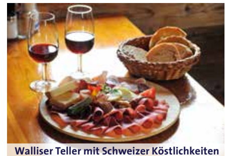
Walliser Teller mit Schweizer Köstlichkeiten