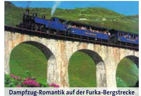
Dampfzug-Romantik auf der Furka-Bergstrecke