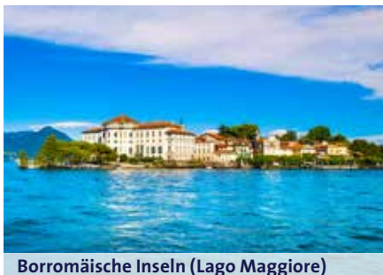
Borromäische Inseln (Lago Maggiore)