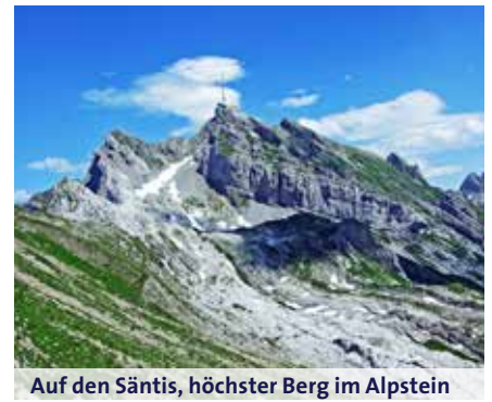
Auf den Säntis, höchster Berg im Alpstein