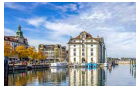
Schiffstour auf dem Bodensee bei Rorschach

zeller Hinterland, das seine Ursprünglichkeit noch bewahrt hat. Weiter geht's zur Schwägalp und von dort auf den Säntis, den höchsten Berg im Alpstein. Willkommen in einer der schönsten Naturkulissen