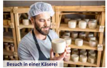
Besuch in einer Käseerei

Wir fahren am Morgen mit dem Zug von St. Gallen nach Urnäsch, dem malerischen Dorf im Appen-