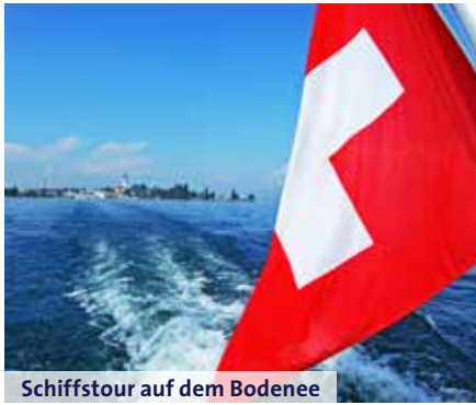
Schiffstour auf dem Bodensee