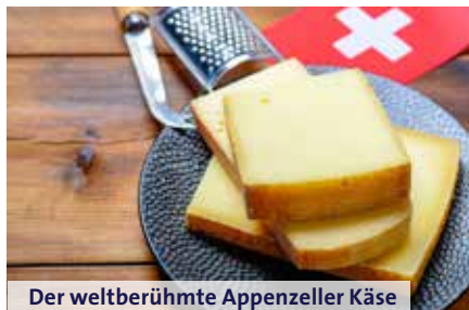
Der weltberühmte Appenzeller Käse