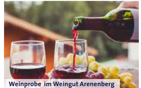
Weinprobe im Weingut Arenenberg