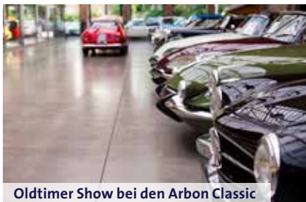
Oldtimer Show bei den Arbon Classic