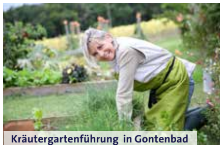
Kräutergartenführung in Gontenbad