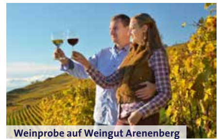
Weinprobe auf Weingut Arenenberg