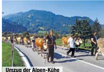
Umzug der Alpen-Kühe