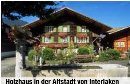
Holzhaus in der Altstadt von Interlaken