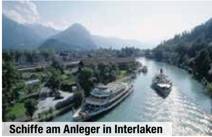
Schiffe am Anleger in Interlaken