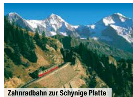
Zahnradbahn zur Schynige Platte