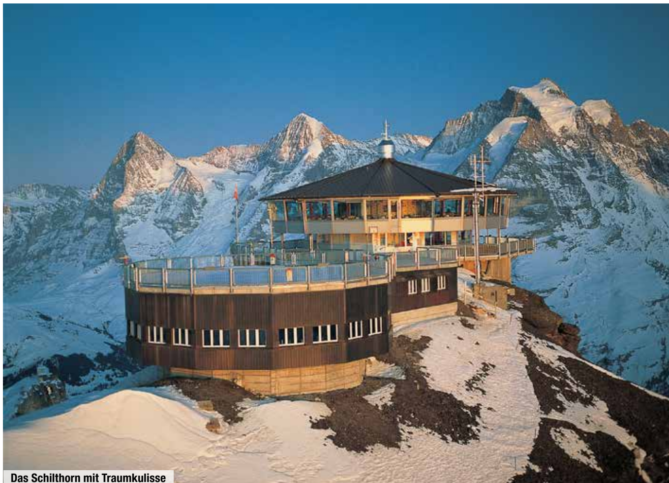
Das Schilthorn mit Traumkulisse