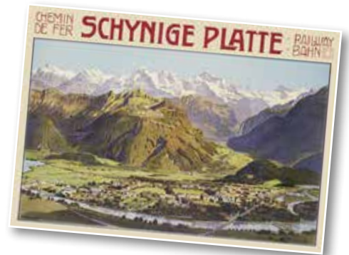
Stationen der Reise

Individuelle Anreise in der 2. Klasse über Basel nach Interlaken.