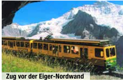
Zug vor der Eiger-Nordwand