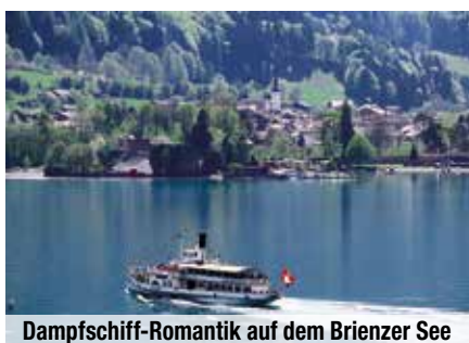
Dampfschiff-Romantik auf dem Brienzer See