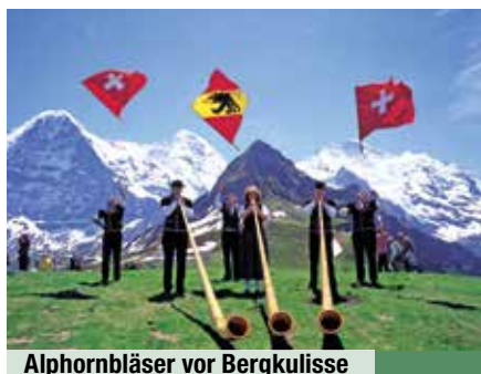
Alphornbläser vor Bergkulisse