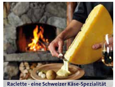
Raclette - eine Schweizer Käse-Spezialität