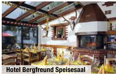
Hotel Bergfreund Speisesaal

Das Hotel*** Bergfreund in Herbruggen sowie das Hotel**** Europe in Davos haben schon viele unserer Kunden schätzen und lieben gelernt. Das etwas einfachere, aber sehr familiär geführte „Bergfreund“ mit der Gastwirtin Rosie zeichnet sich durch Schweizer Herzlichkeit sowie sehr gute und reichhaltige Küche aus. Das Hotel „Europe“ in Davos bietet in seiner zentralen und günstigen Lage direkt am Bahnhof ein komfortables Urlaubsdomizil zum Wohlfühlen und Relaxen mit Sonnenterrasse und 2 Restaurants, die mit internationalen und regionalen Schweizer Spezialitäten verwöhnen.