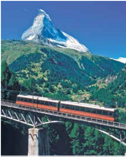
Gornergrat-Bahn vor dem imposanten Matterhorn