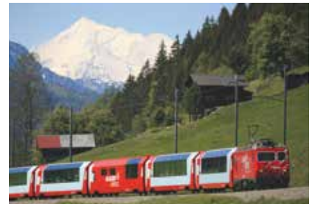
Premium-Glacier-Express vor dem Weißhorn