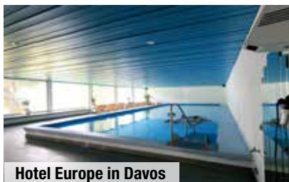
Hotel Europe in Davos

Das Hotel*** Bergfreund in Herbruggen sowie das Hotel**** Europe in Davos haben schon viele unserer Kunden schätzen und lieben gelernt. Das etwas einfachere, aber sehr familiär geführte „Bergfreund“ mit der Gastwirtin Rosie zeichnet sich durch Schweizer Herzlichkeit sowie sehr gute und reichhaltige Küche aus. Das Hotel „Europe“ in Davos bietet in seiner zentralen und günstigen Lage direkt am Bahnhof ein komfortables Urlaubsdomizil zum Wohlfühlen und Relaxen mit Sonnenterrasse und 2 Restaurants, die mit internationalen und regionalen Schweizer Spezialitäten verwöhnen.