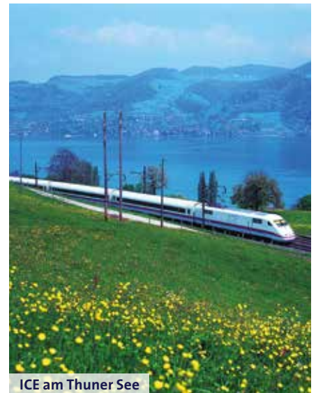
ICE am Thuner See