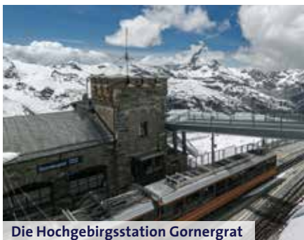
Die Hochgebirgsstation Gornergrat