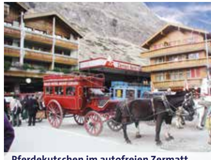
Pferdekutschen im autofreien Zermatt