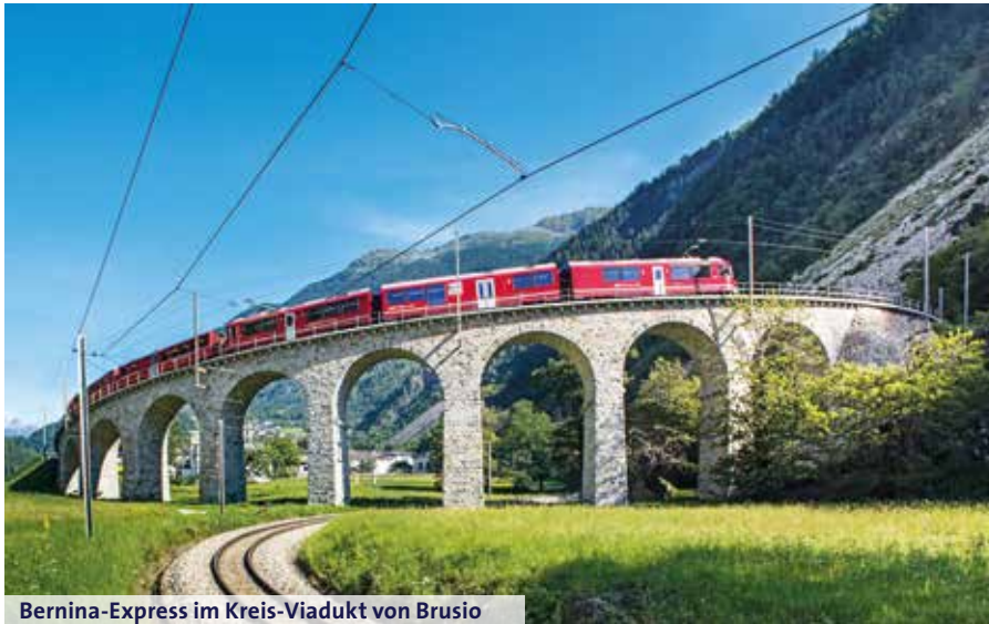
Bernina-Express im Kreis-Viadukt von Brusio