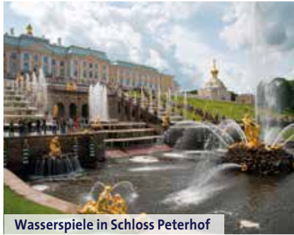
Wasserspiele in Schloss Peterhof

Die Ursprünge der Stadt liegen am Wasser. In der Peter-Paul-Festung an der Newa wurde 1703 von Zar Peter der Grundstein gelegt. Majestätische Kathedralen, triumphale Palast-Fassaden, golden funkelnde Turmadeln spiegeln sich in den malerischen Kanälen, den Lebensadern der Stadt. Während der Stadtrundfahrt wird uns das zaristische sowie revolutionäre Russland nahegebracht. Am Nachmittag bestaunen wir in Peterhof an der Newa-Bucht einen Superlativ architektonischer Gartenbau-Kunst. Der Park besteht aus dem Unteren und dem Oberen Garten mit zahlreichen Kaskaden sowie fantasievollen Wasserspielen mit