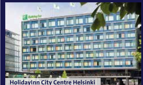
HolidayInn City Centre Helsinki

Für die Übernachtungen haben wir stets zentral gelegene und komfortable Hotels in der internationalen First-Class-Kategorie ausgewählt. Diese entsprechen unseren 4**** bzw. 4****-Superior-Hotels. Geplant sind Hotel Polonia Palace Warschau, Holiday Inn Hotel Helsinki und Radisson Blu Lübeck. Im Schlafwagen-Zug von Warschau nach Moskau reisen wir in klassischen 2-Bett-Abteilen. Toiletten befinden sich am Wagende. Auf der Fähre reisen wir ebenfalls in Zweibett-Kabinen überwiegend außen, mit zwei unteren Betten. Die Kabinen verfügen über Dusche und WC.