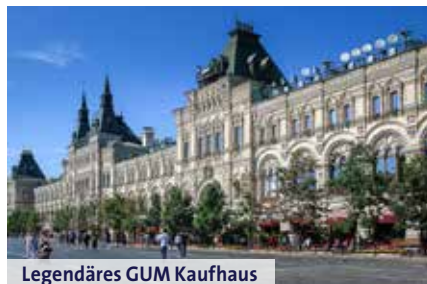
Legendäres GUM Kaufhaus