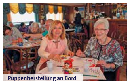
Puppenherstellung an Bord