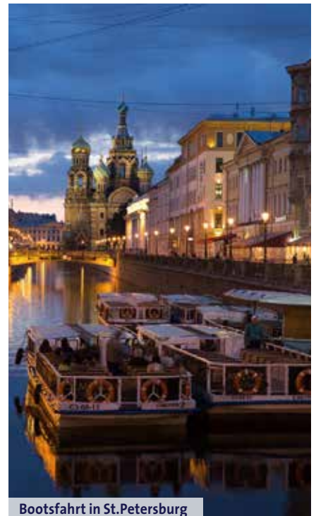
Bootsfahrt in St.Petersburg